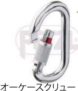
オーケースクリュー