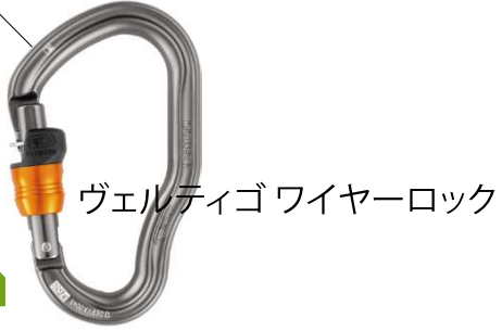
ヴェルティゴワイヤーロック